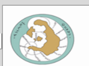
Thira Municipality, GREECE